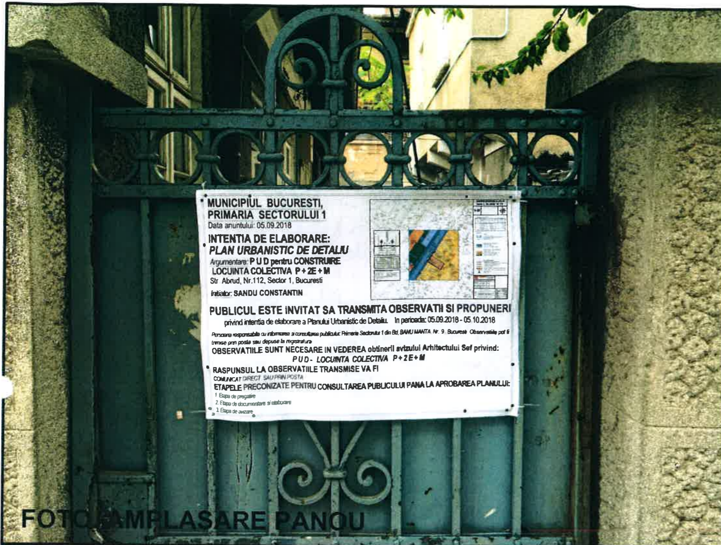
FOTO AMPLASARE PANOU