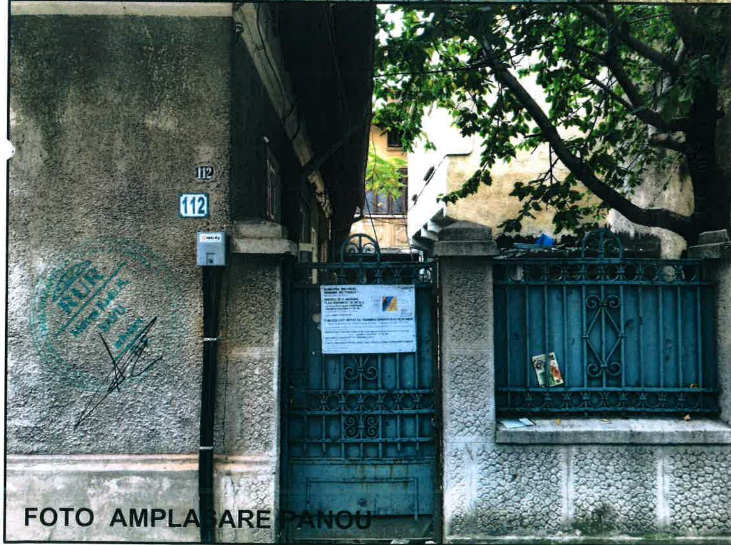
FOTO AMPLASARE PANOU