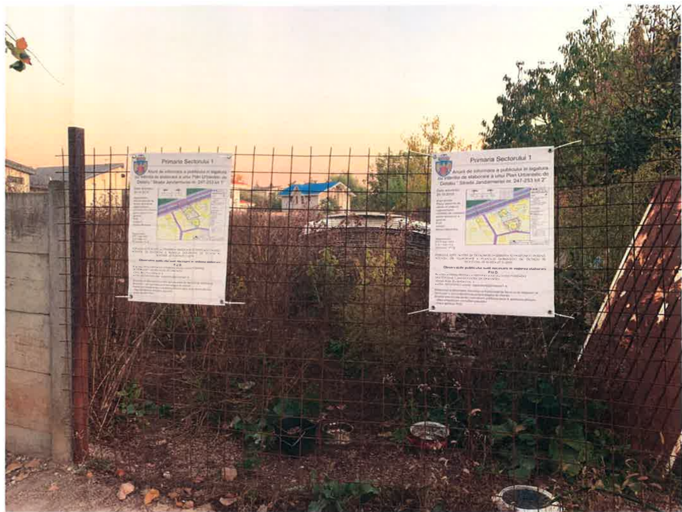
PANOU AMPLASAT PE 25.10.2019