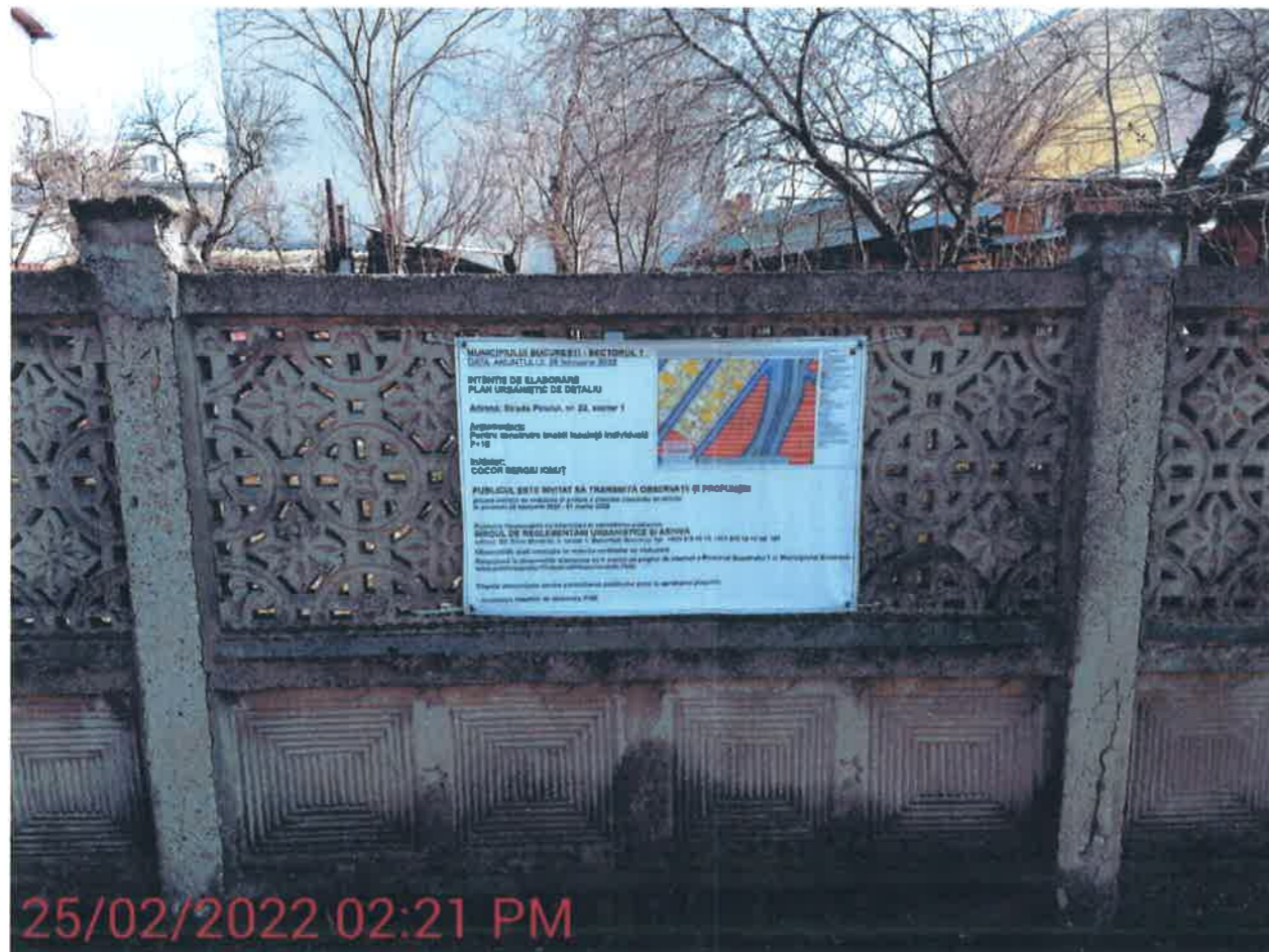
25/02/2022 02:21 PM

MUNICIPIULUI BUCUREȘTI - SECTORUL 1 DATA ANUNȚULUI: 25 februarie 2022