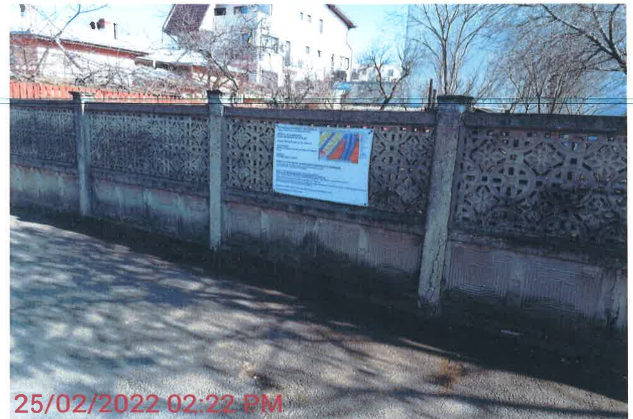
25/02/2022 02:22 PM