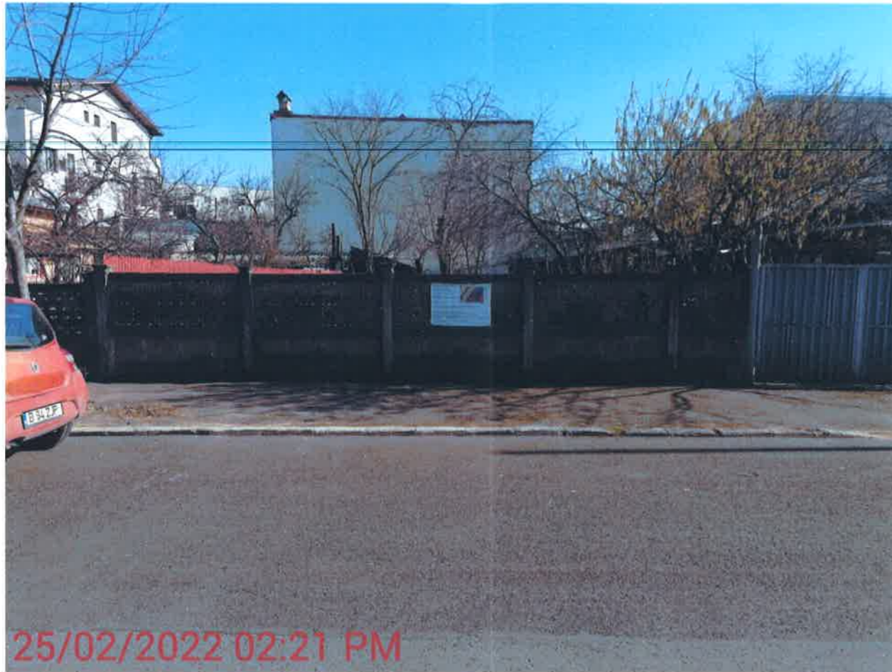
25/02/2022 02:21 PM