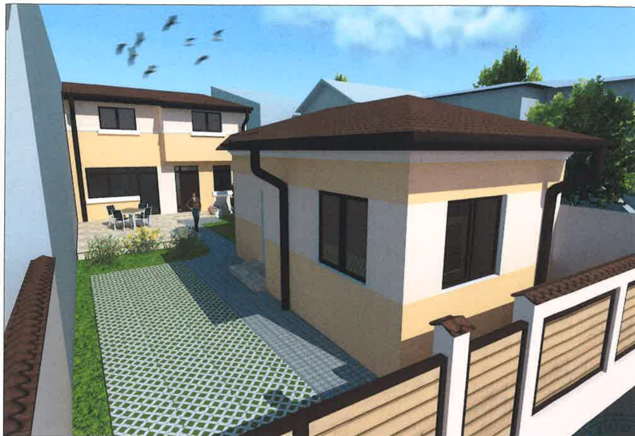
ILUSTRARE DE TEMA - VEDERE DIN STRADA VOLUMULUI