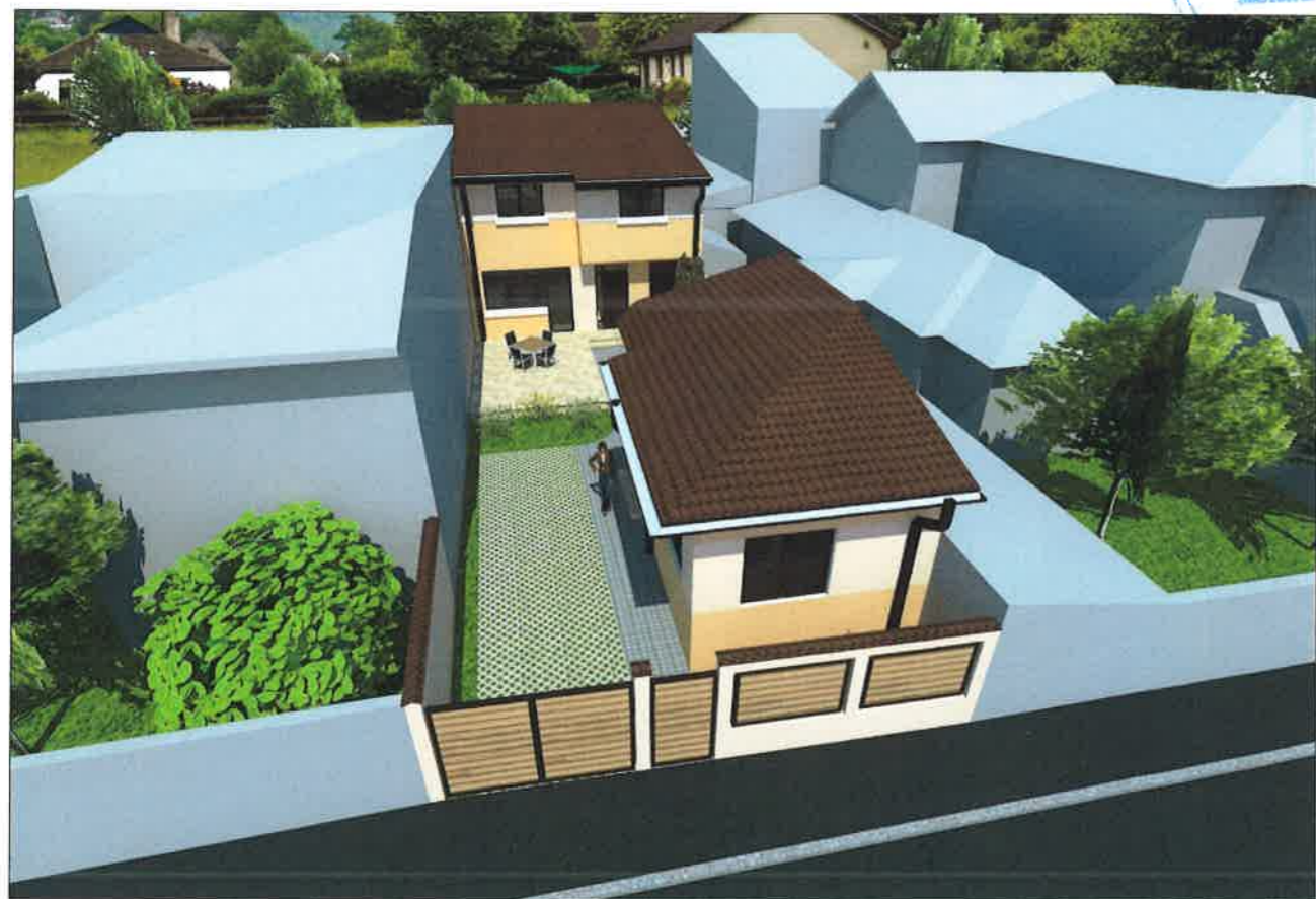
ILUSTRARE DE TEMA - VEDERE AERIANA - 1